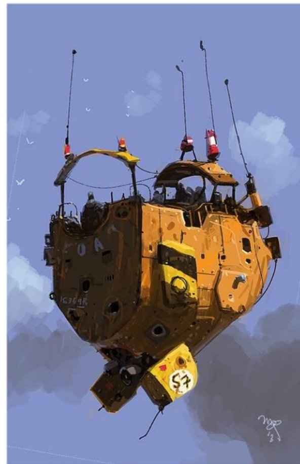
Illustration : Ian Mcque