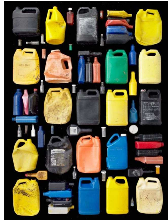
Barry Rosenthal Série Trouvés dans la nature Barils et flacons 2011 Photographie