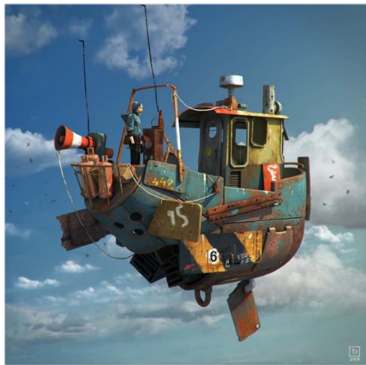
Illustration : Moran Tennenbaum