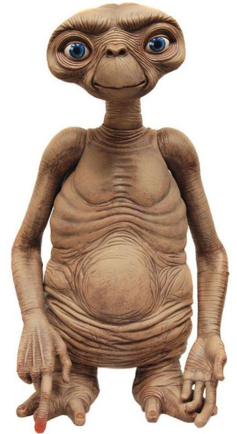
E.T., l'extraterrestre Un film de Steven Spielberg , 1982

Tu pourras ensuite repasser les contours au feutre noir ou au stylo noir, et terminer en les mettant en couleur.