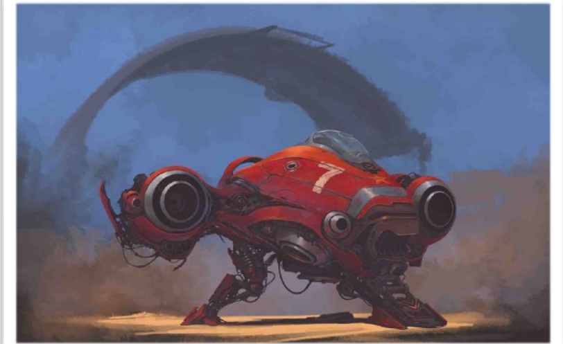
Illustrations : Alejandro Burdisio