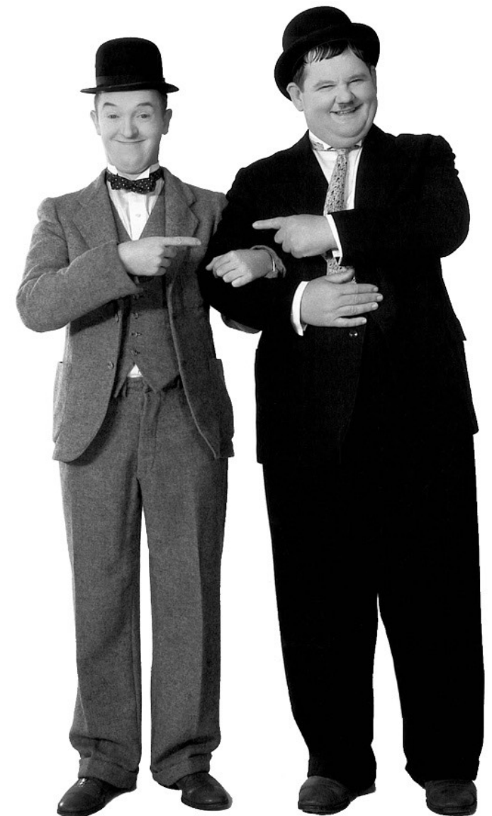
Laurel et Hardy