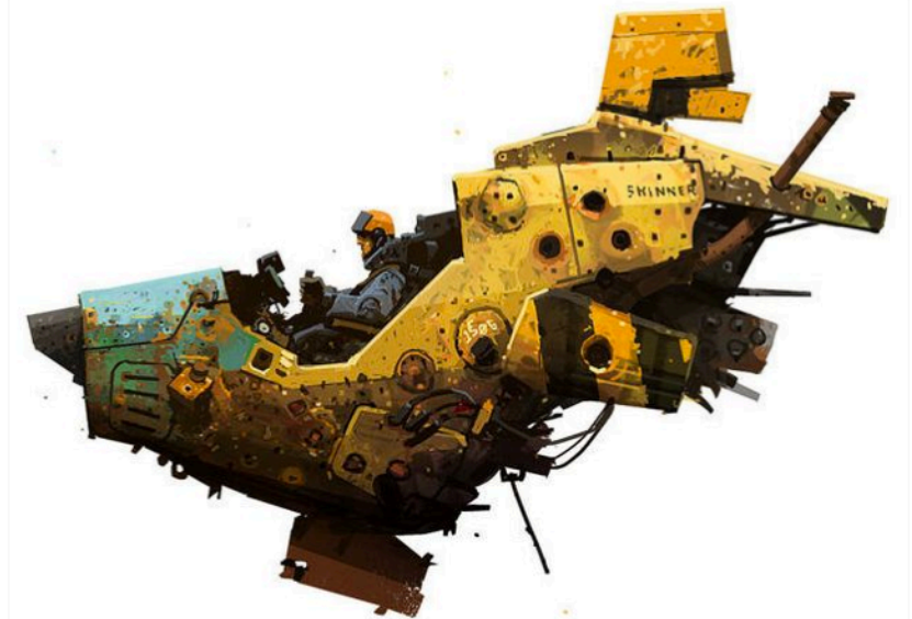
Illustration : Paul H Paulino