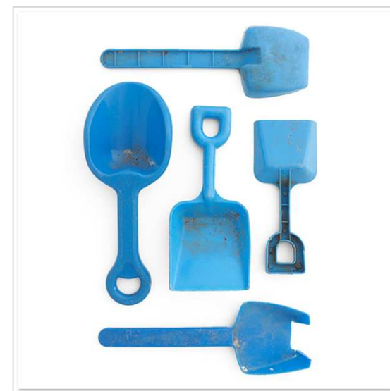
Barry Roshental Série Trouvés dans la nature Pelles Bleues, Brooklyn, New York Photographie

Utilise un crayon à papier et une gomme. Il n'est pas nécessaire de colorier ce dessin.